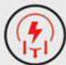
LOW POWER CONSUMPTION