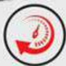
30.000+ HRS LIFESPAN