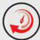
30.000+ HRS LIFESPAN