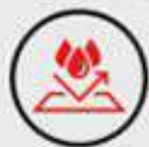
IP66 WATER & DUST RESISTANT