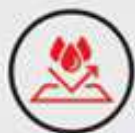
IP66 WATER & DUST RESISTANT