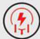
LOW POWER CONSUMPTION