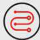
WIRING & SWITCH INCLUDED