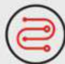
WIRING & SWITCH INCLUDED