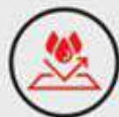
IP66 WATER & DUST RESISTANT